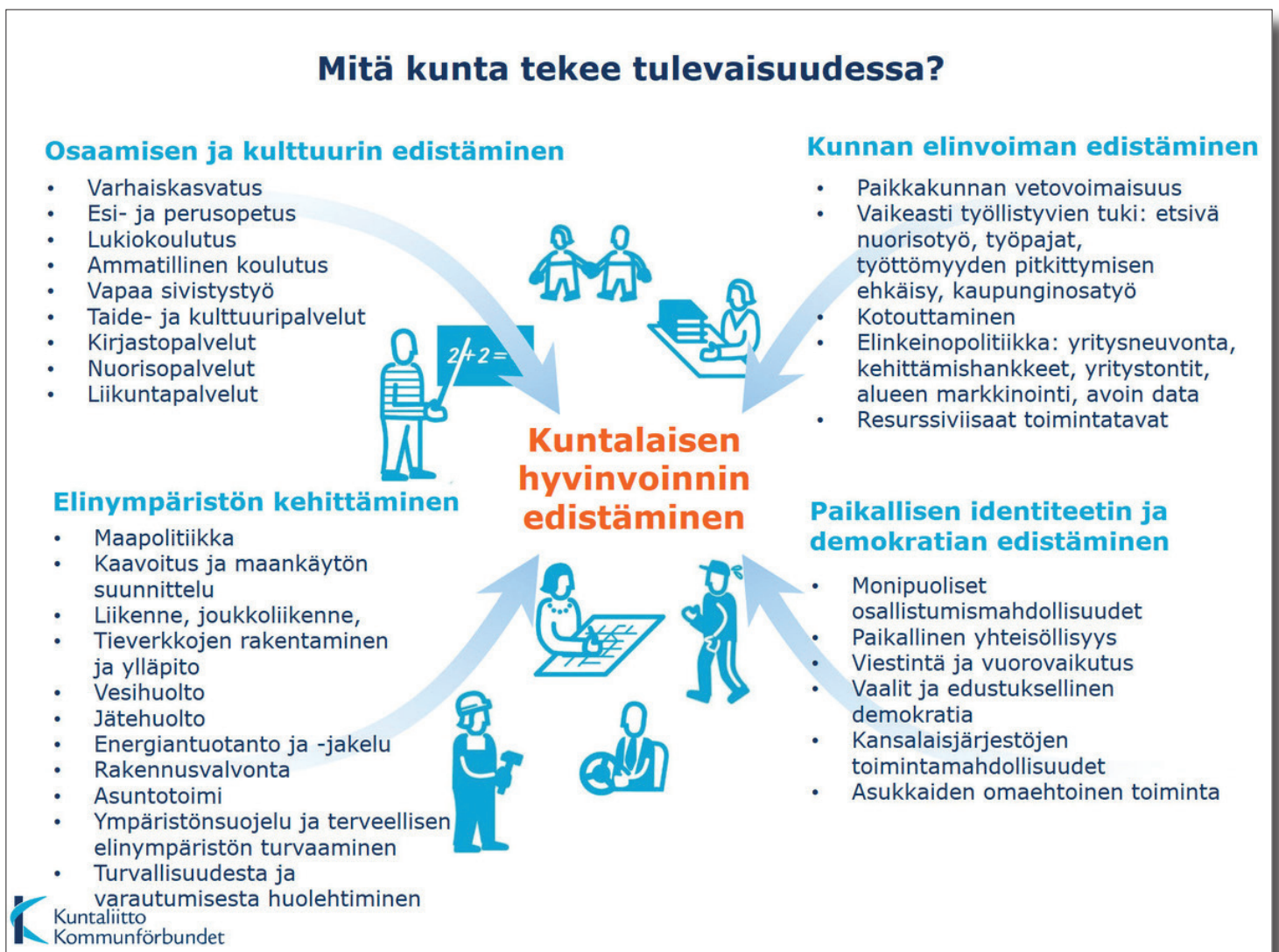
Kuva 1. Kunnan tehtävät tulevaisuudessa. Lähde: Kuntaliitto (20.6.2022): www.kuntaliitto.fi/ajankohtaista/2017/mita-kunta-tekee-sote-ja-maakuntauudistuksen-jalkeen

Kaikilla Kuntaliiton esiin nostamilla osa-alueilla myös yhdistyksillä ja järjestöillä on roolia, näkyvimmin osaamisen ja kulttuurin edistämässä (mm. kulttuuri- ja liikuntapalvelut) sekä paikallisen identiteetin ja demokratian edistämässä (mm. paikallinen yhteisöllisyys). Ilman kolmannen sektorin toimijoiden kanssa tehtävää yhteistyötä kuntien on vaikeaa toteuttaa tehtäviään laadukkaasti. Kuntaliitto on myös nostanut kunnan tärkeäksi tehtäväksi kansalaisjärjestöjen toimintamahdollisuuksien edistämisen/ylläpitämisen.